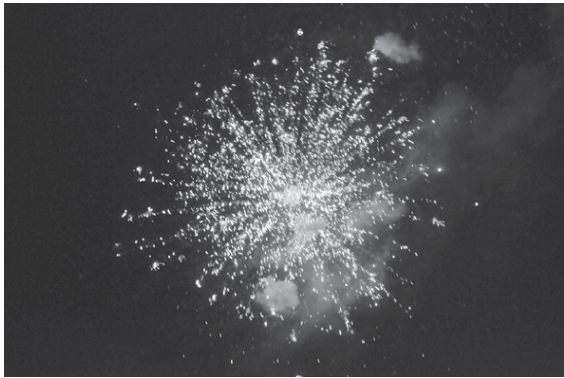
O projeto prevê que o descumprimento ao disposto na lei acarrete ao infrator

No projeto de lei, o deputado também propôs a Semana de Prevenção de Acidentes e de Conscientização contra o uso imoderado de fogos de artifício em Defesa do Meio Ambiente e dos Animais de Estimação com o intuito de disseminar a conscientização para a boa utilização dos fogos de animação, festivos ou comemorativos através de palestras, seminários, campanhas e