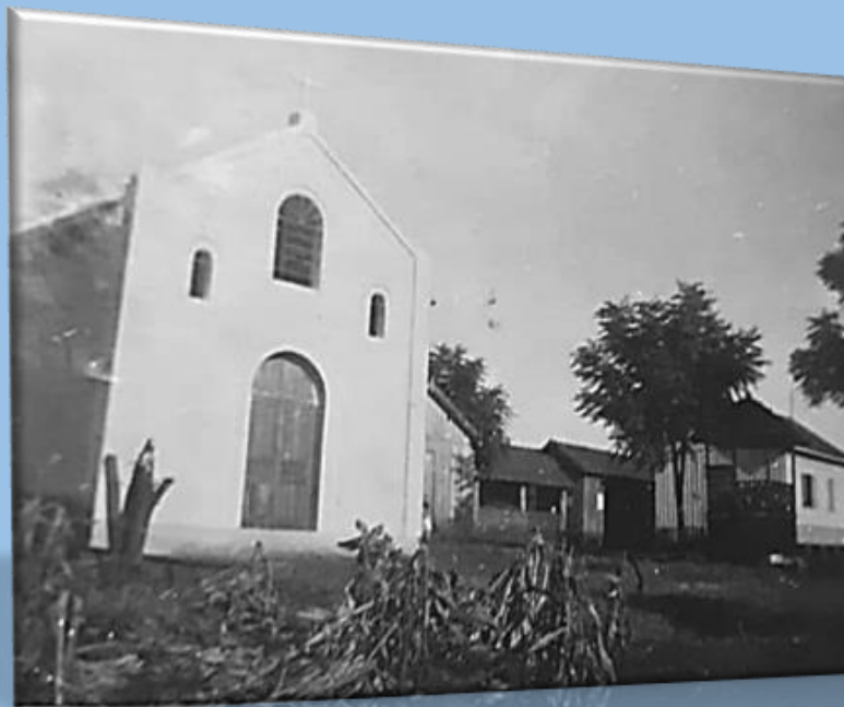
FOTO DA ESCOLA AO FUNDO EM 1988

UMA DAS MAIS ANTIGAS ESCOLAS DO MUNICIPIO, FUNDADA EM 1929 E TENDO FUNCIONADO ATÉ 2015 FOI A ESCOLA RURAL QUE MATRICULOU O MAIOR NUMERO DE ALUNOS, TENDO PASSADO POR ELA 1908 ALUNOS