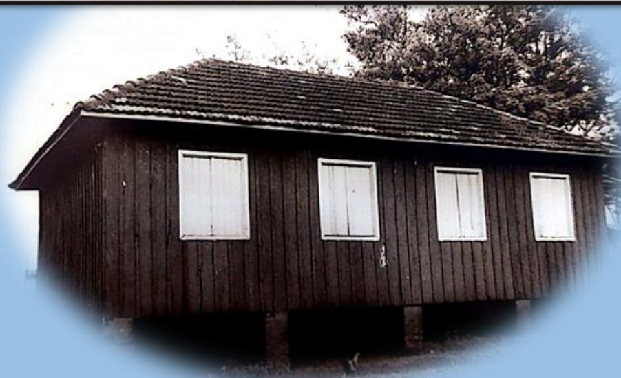
ESCOLA MONTEIRO LOBATO - ABRIL DE 1980