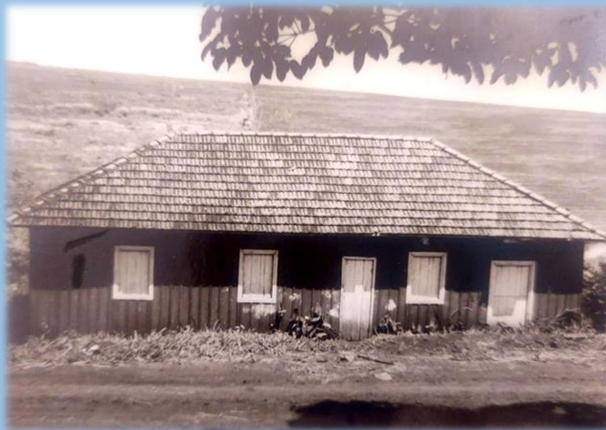
LOCALIZAÇÃO DA ESCOLA NO MUNICÍPIO