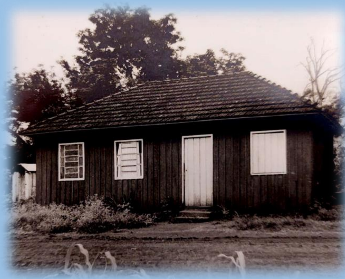
FOTO DA ESCOLA EM ABRIL DE 1980

INICIADA EM 1965, ESSA ESCOLA TEVE CERCA DE 441 ALUNOS ATE O ENCERRAMENTO EM 08 DE FEVEREIRO DE 1995.