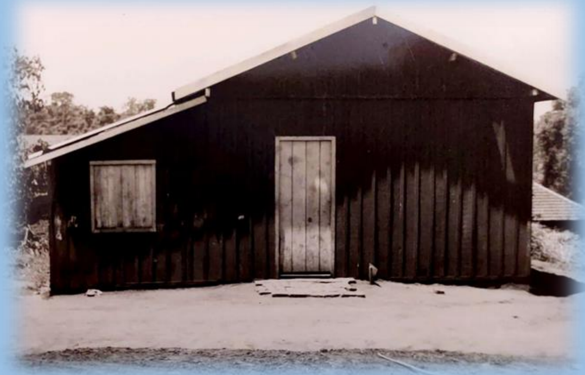
LOCALIZAÇÃO DA ESCOLA NO MUNICIPIO