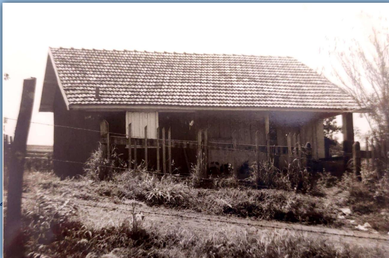
FOTO DA ESCOLA EM ABRIL DE 1980