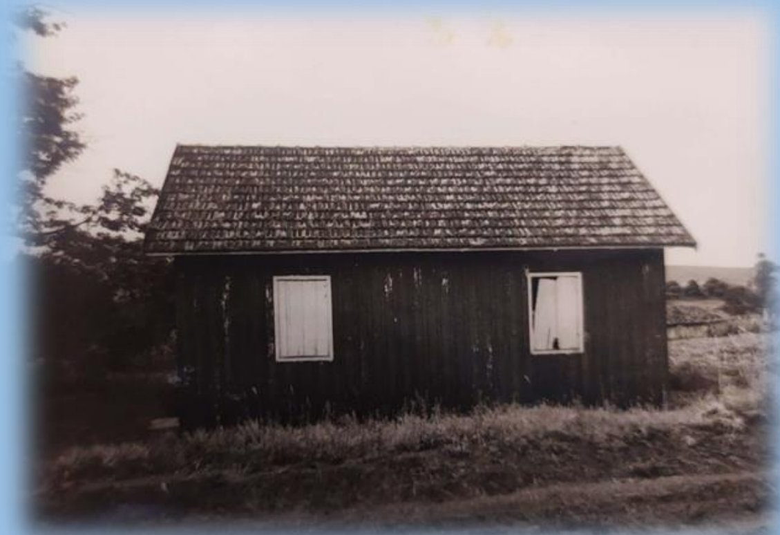
ESCOLA CRISÓVÃO COLOMBO - ABRIL DE 1980