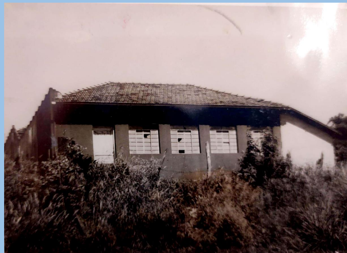
FOTO DA ESCOLA EM ABRIL DE 1980

INICIADA EM 1964, NO BAIRRO TAQUARAL, ENCONTRAMOS 428 REGISTROS DE ALUNOS QUE SE MATRICULARAM E ESTUDARAM NESTA ESCOLA.